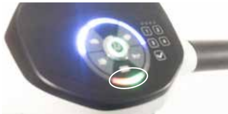
Normal: luz sólida | Anormal: luz intermitente

Si la advertencia de autodiagnóstico se enciende con 1/2/4/5 veces, consulte las soluciones anteriores (apague y reinicie nuevamente o cargue la batería). Si ninguno de los problemas anteriores corrige, comuníquese con su distribuidor autorizado.