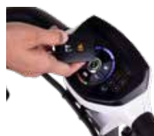
Mando y pantalla táctil