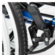
Freno de aluminio