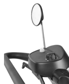
Panel de control