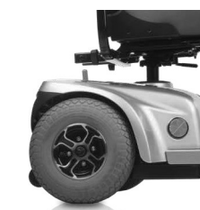
Parte lateral del scooter