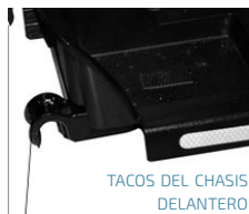
TACOS DEL CHASIS DELANTERO