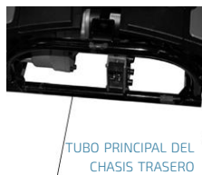
TUBO PRINCIPAL DEL CHASIS TRASERO

Para volver a montar, deje que la sección trasera del scooter descansa hacia atrás sobre las ruedas antivuelco. Levante la sección delantera por el poste del asiento hacia la sección trasera y ubique las agarraderas en cada lado del chasis sobre el tubo principal de la sección trasera como se muestra a continuación. El frente se puede bajar suavemente hasta su posición. Cuando baje, empuje hacia abajo el poste del asiento y escuchará que las secciones delantera y trasera encajan en su lugar. Para garantizar una conexión segura, tire del poste del asiento para asegurarse de que la parte trasera esté conectada correctamente.