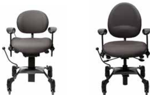
VELA Tango 100