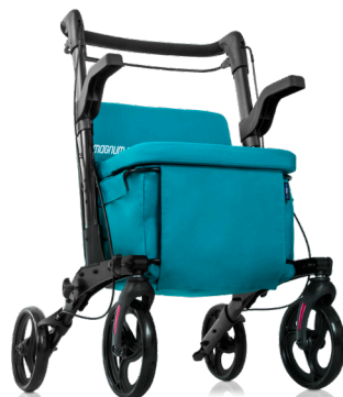
MAGNUM SHOP PLUS