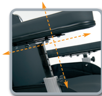
Apoyabrazos extraíbles y ajustables en profundidad, altura y anchura.

Silla de ruedas equipada con ruedas trasera Krypton de 24", que pueden ser extraídas gracias a su sistema "Quick release". Ruedas delanteras de 200 mm x 35 mm. El reposacabezas se puede ajustar en altura, profundidad y anchura