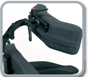
Cómodo reposacabezas ajustable a sus necesidades