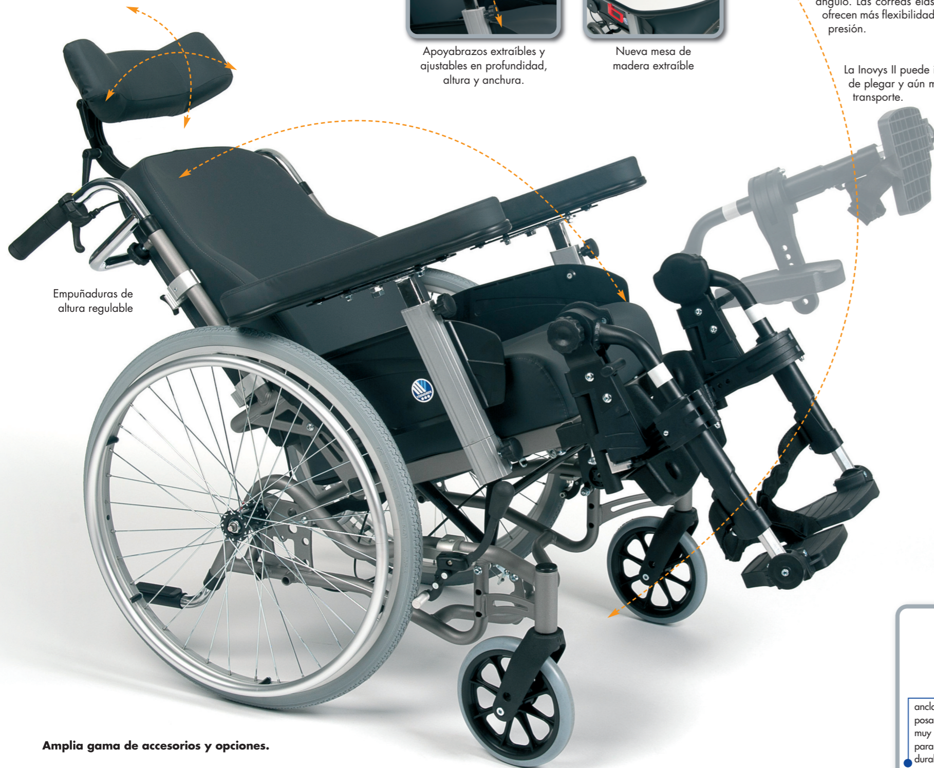
Empuñaduras de altura regulable

La Inovys II puede inclinarse totalmente, es fácil de plegar y aún más fácil desmontarla para el transporte.