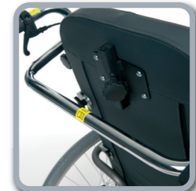
Barra de empuje de una sola pieza