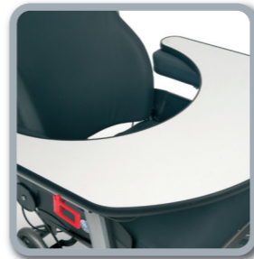
Nueva mesa de madera extraíble

La nueva Inovys II ofrece un confort óptimo para el usuario. Está equipada con un asiento y respaldo en Dartex para un perfecto confort. El nuevo sistema de anclaje para el respaldo permite que se ajuste en profundidad, altura y ángulo. Las correas elásticas del interior del asiento ofrecen más flexibilidad y confort evitando puntos de presión.