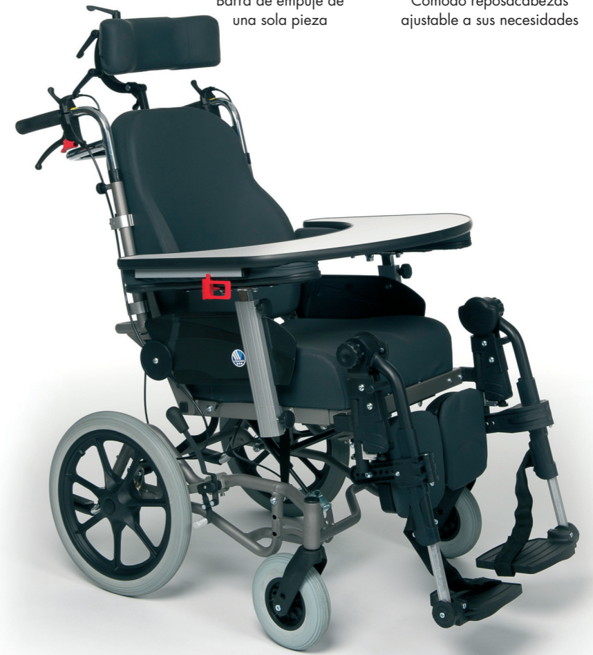
Modelo con BZ8C y B12A