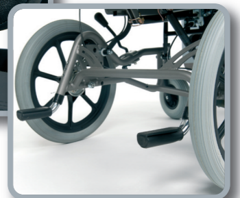
Pisapiés de serie