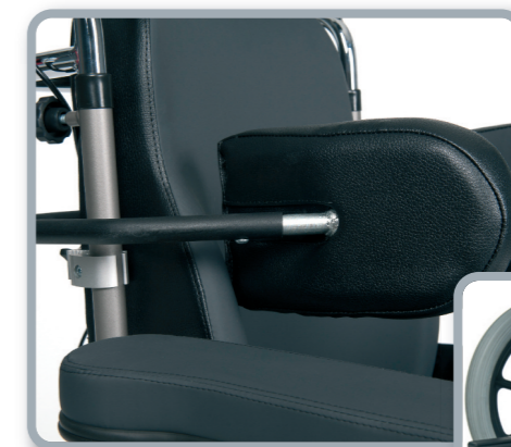
L04 - Soportes laterales (opcional)