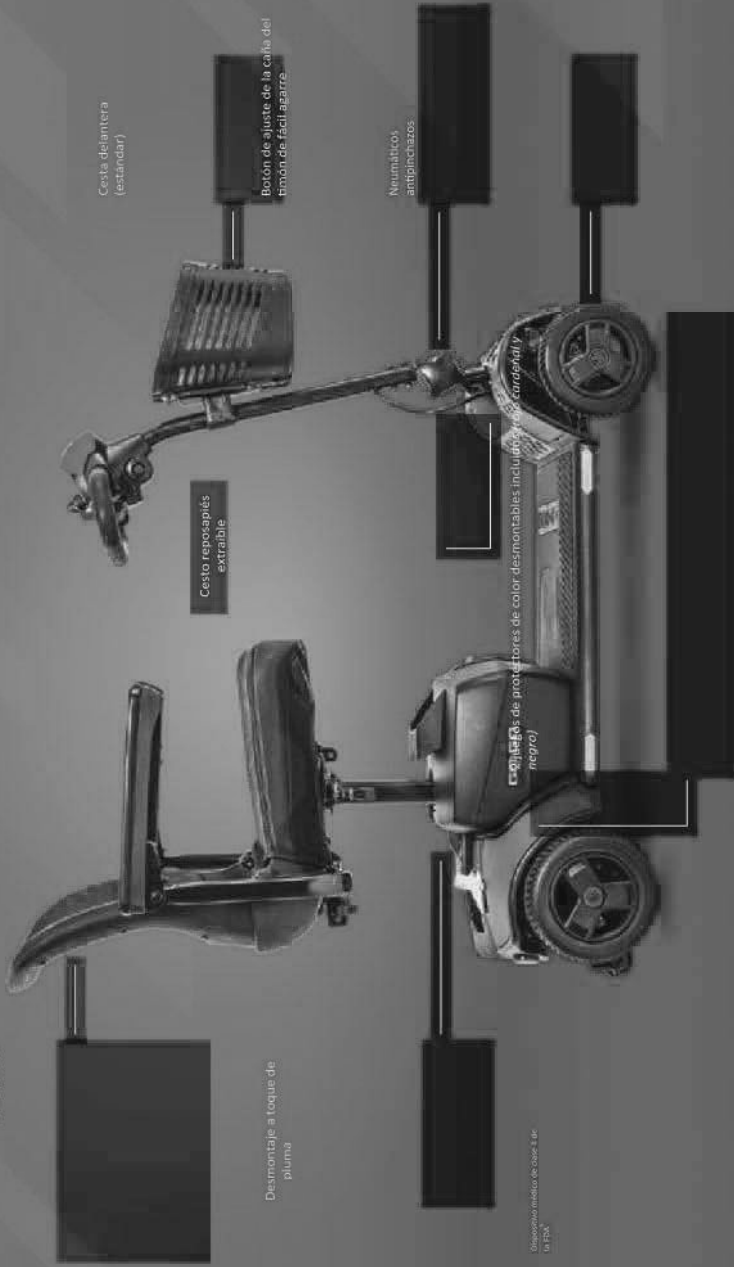
Cesta delantera (estándar)

Nuevo asiento compacto y plegable con respaldo de malla transpirable y ajustable reposabrazos