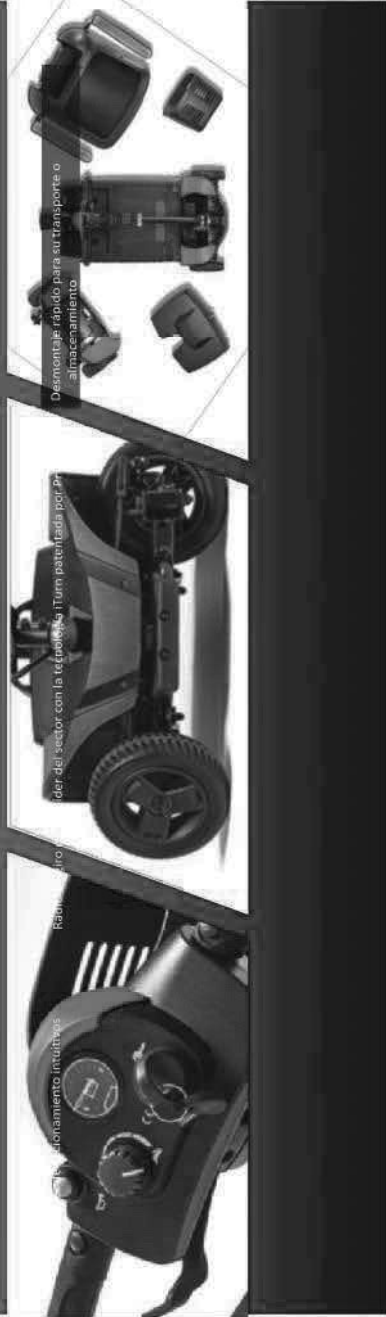
Panel de control intuitivo

* Solo se puede utilizar un accesorio trasero a la vez.