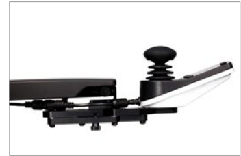
Soporte basculante joystick