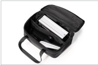
Bolsa para batería y joystick