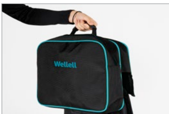
Maletín (Válido para I-Explorer Noa Compact)