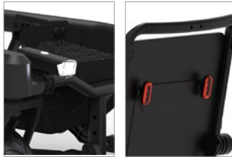
Luz delantera y trasera