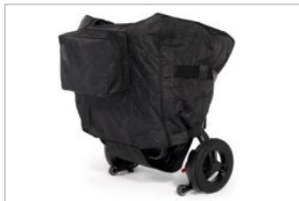
Bolsa de transporte