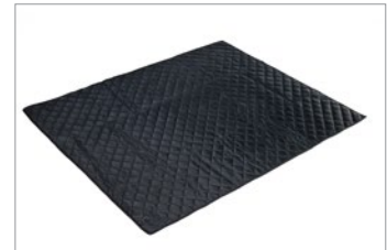
Manta protectora para el maletero