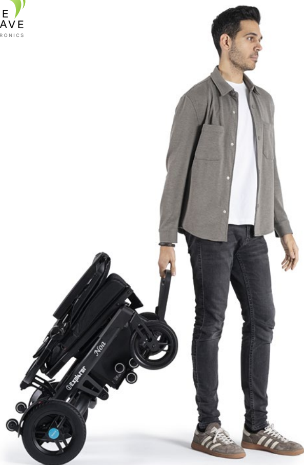
I-Explorer Noa Compact

Fabricadas con materiales de marcas líderes del mercado.