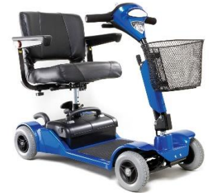
Little Gem2 4 ruedas