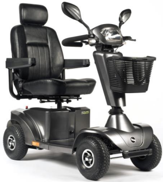
S425 4 ruedas