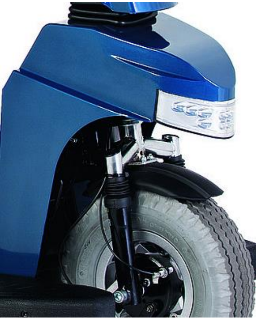
Luces delanteras de LED's