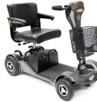
Sapphire2 4 ruedas