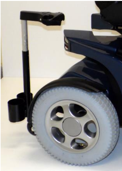
Soporte para bastones