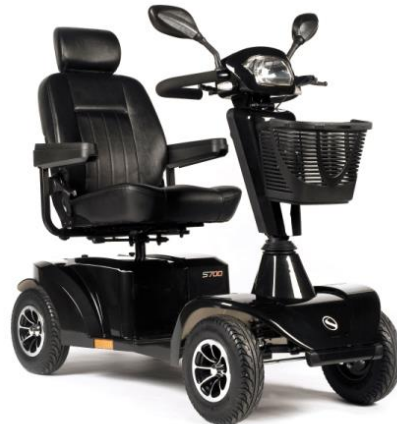
S700 4 ruedas