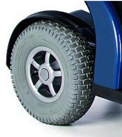
Ruedas traseras de 13" macizas