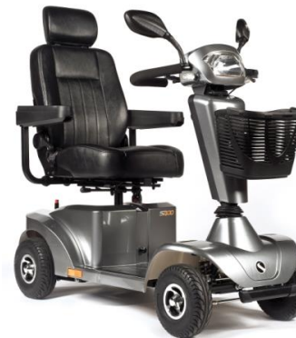
S400 4 ruedas