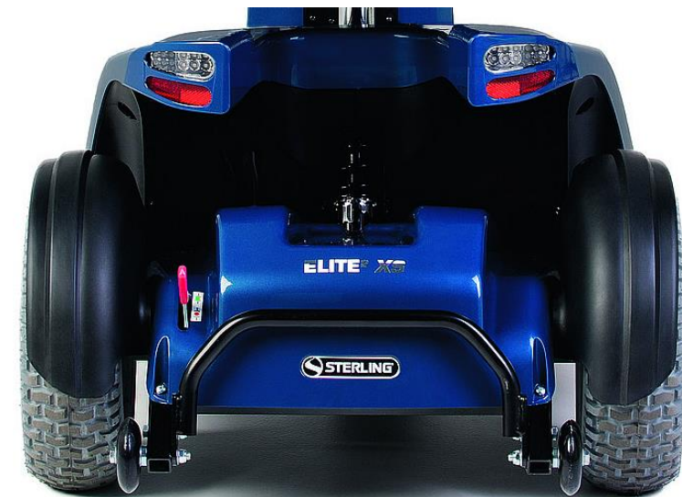
Luces traseras e intermitentes de LED's