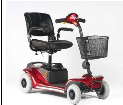
Pearl 4 ruedas