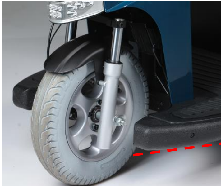
Plataforma con 5° de inclinación para una postura más ergonómica