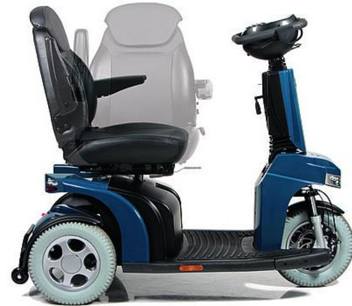
Reposacabezas no incluido en la configuración standard (opcional)