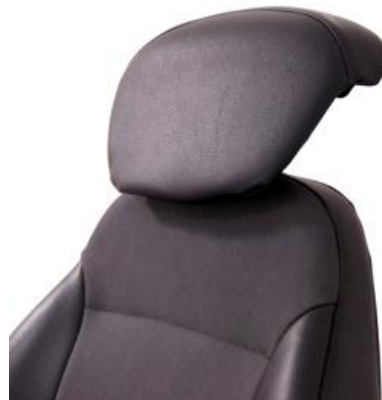
Extensión del respaldo