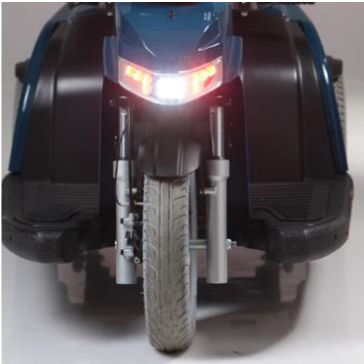
Luces delanteras de LED's