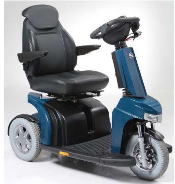
La configuración standard incluye cesta frontal (reposacabezas no incluido)

La Elite 2 Plus ha superado con éxito las pruebas de acuerdo a la normativa ISO-7176-19, lo que la acredita como asiento seguro en un vehículo de transporte