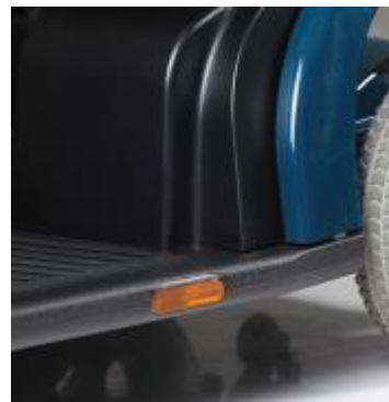
Reflectantes integrados protegidos