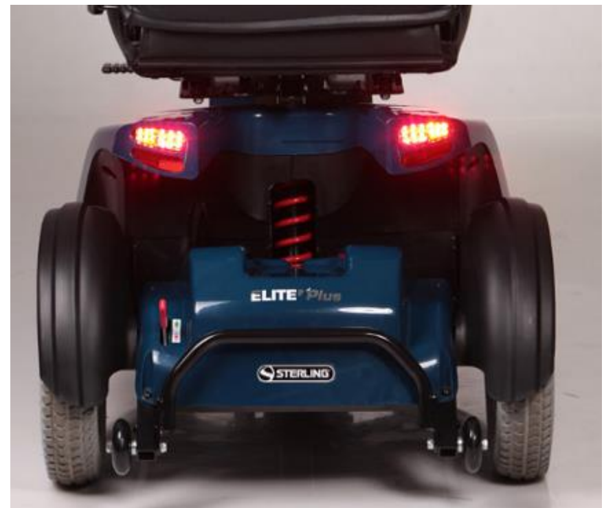
Luces traseras e intermitentes de LED's