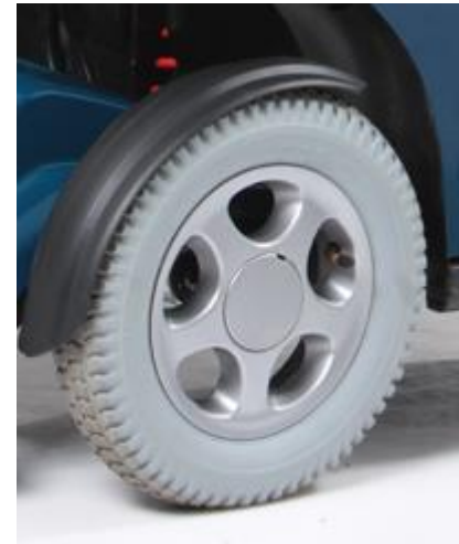
Ruedas de 14" macizas