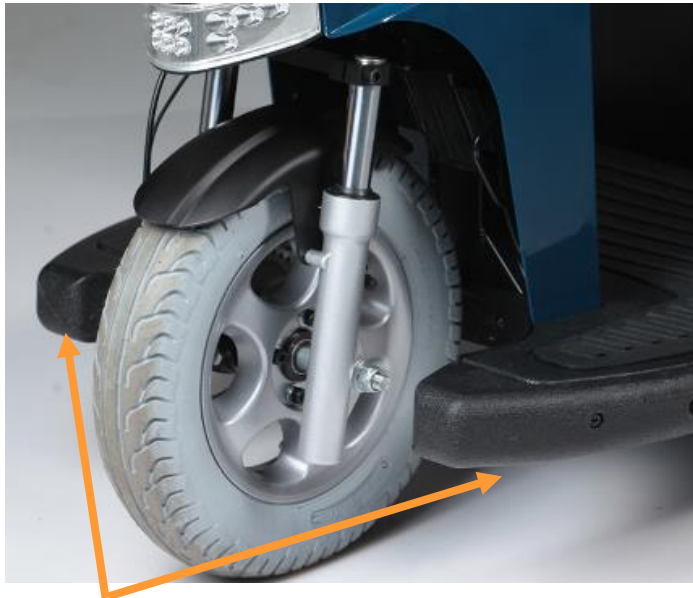
Laterales de goma