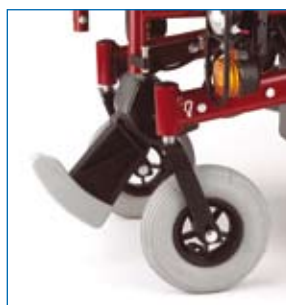
Sube-bordillos [opcional] para superar obstáculos de hasta 10 cm