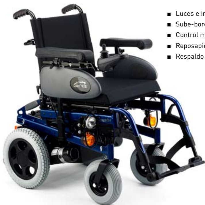
Luces e indicadores para una conducción más segura [opcional]