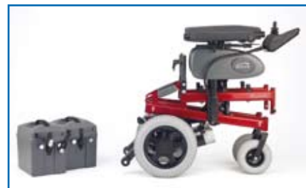
Estructura plegable, respaldo desmontable y baterías extraíbles.

Además los antivuelcos se pliegan cuando hacen tope contra un obstáculo, por lo que la longitud de la silla se ve reducida en 5 cm. Esto es especialmente útil para tener cabida en ascensores. Y es muy robusta .