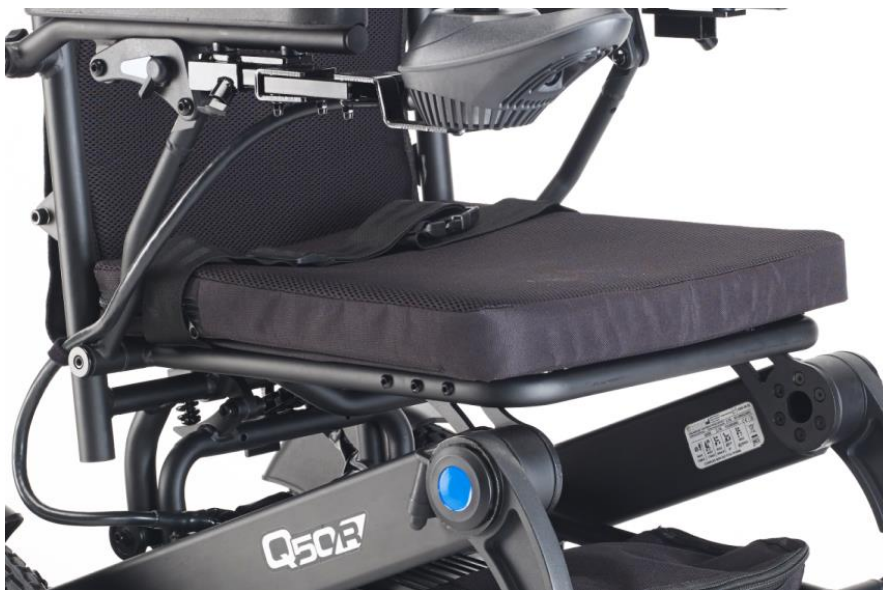
Cojín y cinturón