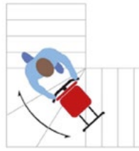
Scala trapezoidale / Trapezoidal staircase