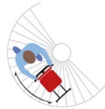
Scala chiocciola / Spiral staircase