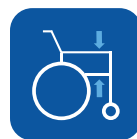
Altura reposabrazos ▼