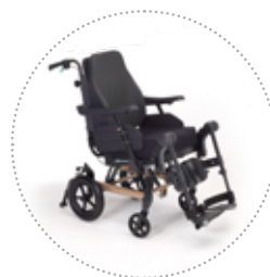
Clematis Pro Stock

Respaldo flexible con cojín anatómico Laguna II. Cojín de asiento Contour Visco NG . Barra de empuje ajustable en ángulo. Alto nivel de personalización gracias a numerosas opciones como el freno tambor disponible sin suplemento de precio.