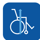
Alto total ▼