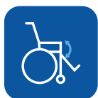
Ángulo de asiento ▼