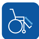
Regulación de los reposapiés ▼