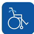
Ángulo respaldo ▼