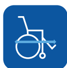
Largo total con reposapiés** ▼