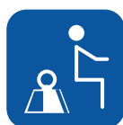
Peso máximo del usuario ▼