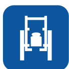
Peso total ▼