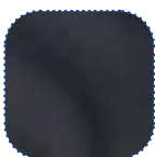
Dartex Negro TR26