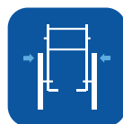
Ancho total ▼