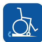
Pendiente máxima con frenos de estacionamiento ▼