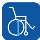
Altura asiento ▼