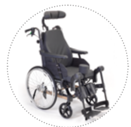
Clematis Pro Configurada