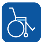
Profundidad asiento ▼