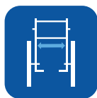
Anchura asiento ▼

Para obtener información más completa acerca de este producto incluyendo el manual del usuario, consulte la página web www.invacare.es