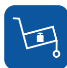
Peso de transporte ▼