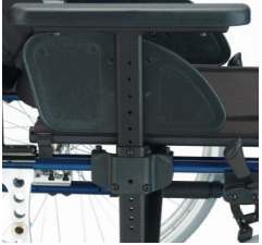
En forma de T