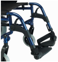
Reposapiés a 70°