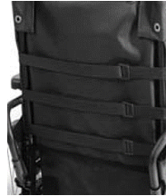
Tapicería nylon 3 cinchas