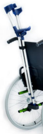
Soporte de bastones