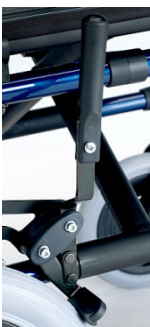
Alargador de freno