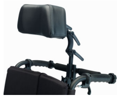
Reposacabezas de skay