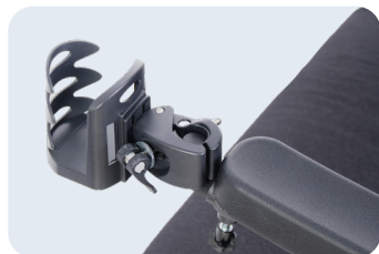
Porta vasos Ref: ACKITCOU+PORTAVASOS