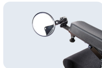
Espejo retrovisor Ref: ACKITCOU+RETROVISOR