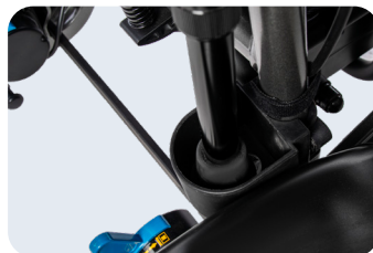
Porta bastón Ref: ACKITCOU+PORTABASTON