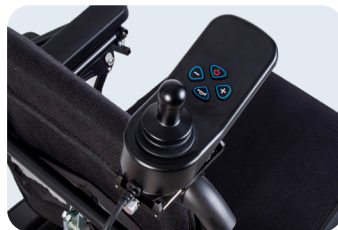
Soporte mando acompañante Ref: ACSOPACOMPAÑANTE