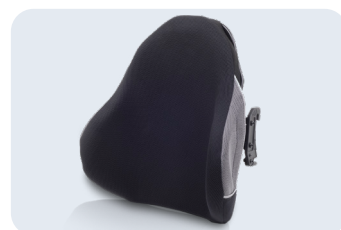
Respaldos anatómicos NXT™ Ref: TRCLASSIC