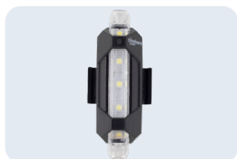
Lightcare® Ref: ACLIGHTCARE