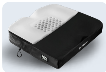
Neo Cushion Ref: TCOJVISCONEO