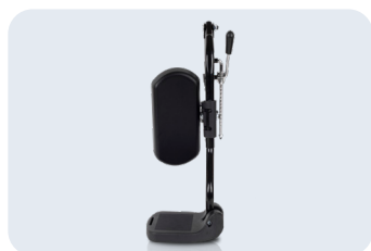
Reposapiés individuales elevables Ref: ACKITCOU+REPINDEL