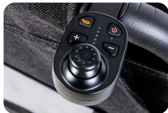
Mando acompañante bluetooth Ref: ACMANDOTRASINCAKICOU

COMPLETE SU KITTOS COUNTRY CON LA AMPLIA GAMA DE ACCESORIOS