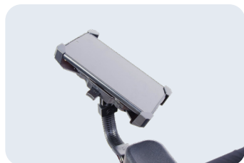
Soporte para teléfonos Ref: ACKITCOU+SOPORTELEFO