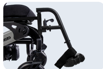
Reposapiés individuales Ref: ACKITCOU+REPIND