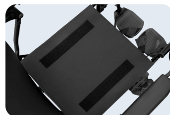
Base rígida Ref: ACKITCOU+BASERIGIDA