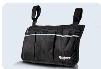
Bolsa lateral Ref: ACBOLSALATERALSILLA