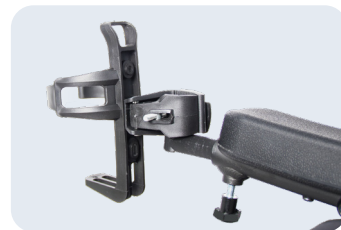
Porta botellas Ref: ACKITCOU+PORTABOTELL