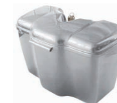
04060551: Baúl delantero