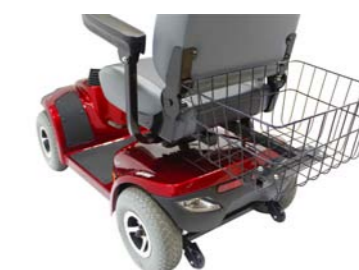
04060549: Cesta trasera