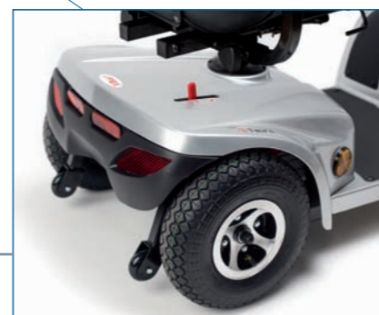
Palanca de desembrague y ruedas antivuelco