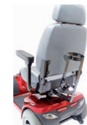
04060548: Soporte botella de oxígeno