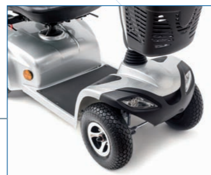
Kit de luces delanteras y de freno