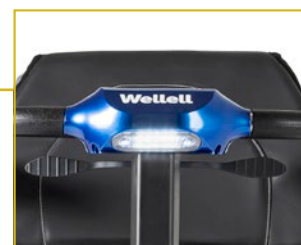
Luz LED delantera