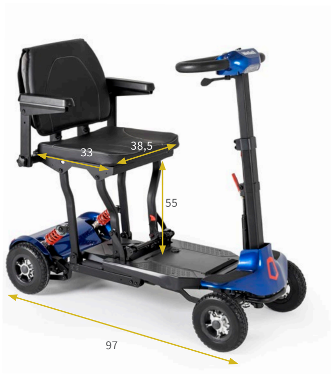
Medidas en cm